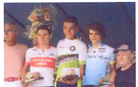
Il podio di Borgomanero con i due atleti ponentini