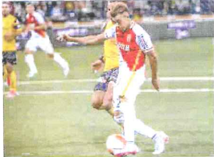
El Shaarawy a Berna: l'ex milanista ha sfiorato il gol nel finale

Nel calcio ogni partita fa storia a sé e le sorprese possono essere sempre dietro l'angolo,