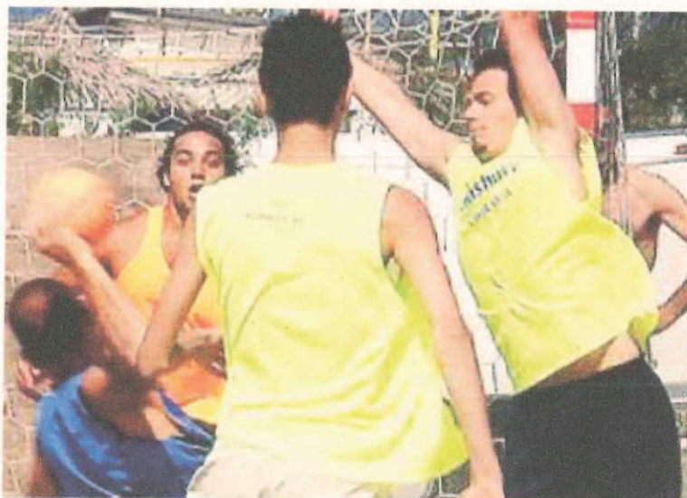
Un'azione di beach handball