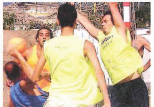
Un'azione di beach handball